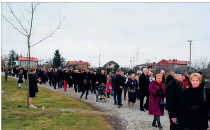
Uroczystość katyńska zgromadziła wielu mieszkańców gminy