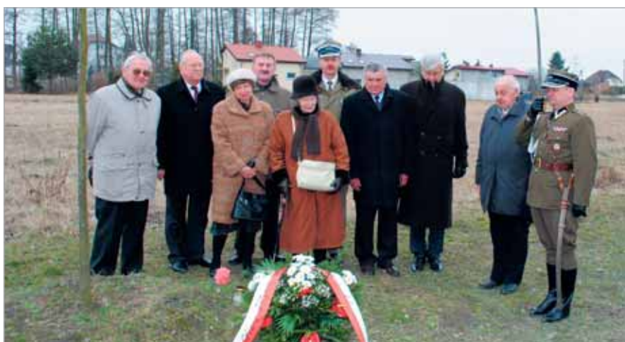
Uczciliśmy Ofiary Wołynia w 70. rocznicę tragedii

dowodzi dzisiejsza uroczystość, mieszkańcy i władze gminy kultywują. Dziękuję za to w imieniu tysięcy Ofiar i ich rodzin, w imieniu zgłodzonej ludności wschodnich terenów Rzeczypospolitej. Trzecie ludobójstwo na Polakach dokonane w czasie II Wojny Światowej, trzecie po niemieckim i sowieckim nie może być zapomniane.