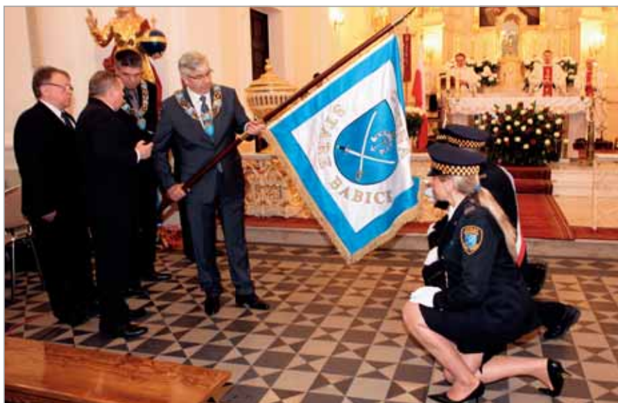
Uroczystość inauguracji Sztandaru Gminy Stare Babice

W tym roku obchodzimy 700-lecie Babic, a także 150. rocznicę wybuchu Powstania Styczniowego, którego wiele dramatycznych epizodów rozgrywało się na tych terenach. Właśnie dzisiaj przypada dokładnie 150. rocznica bitwy pod Budą Zaborowską, którą będziemy