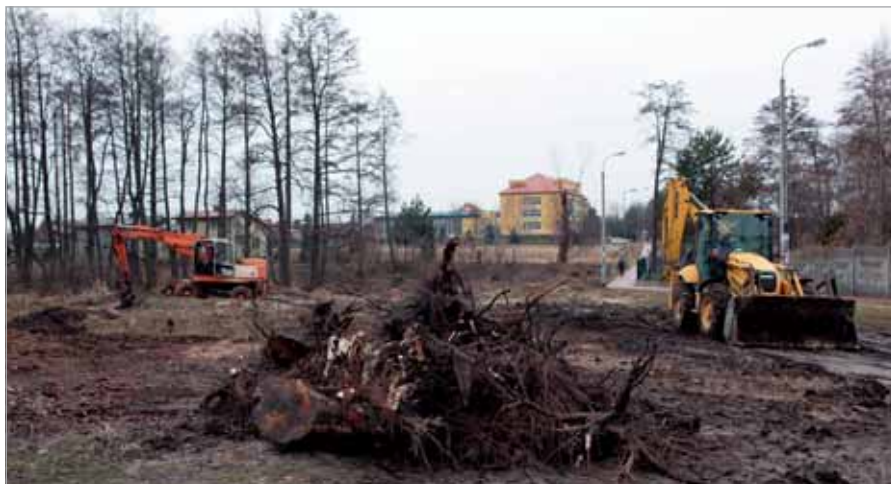
Prace porządkowe przy ul. Sienkiewicza

Na rondach lada chwila rozwiną się kwiaty. Jak wykazała kontrola, posadzone