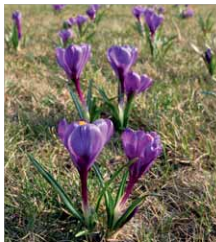
Krokusy przed nowym budynkiem Urzędu Gminy

tam byliny i inne rośliny wieloletnie dobrze przetrwały zimę.