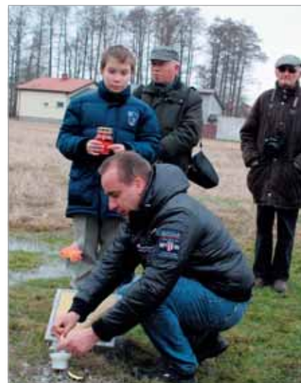
Znicze pamięci zapłonęły przy wszystkich dębach