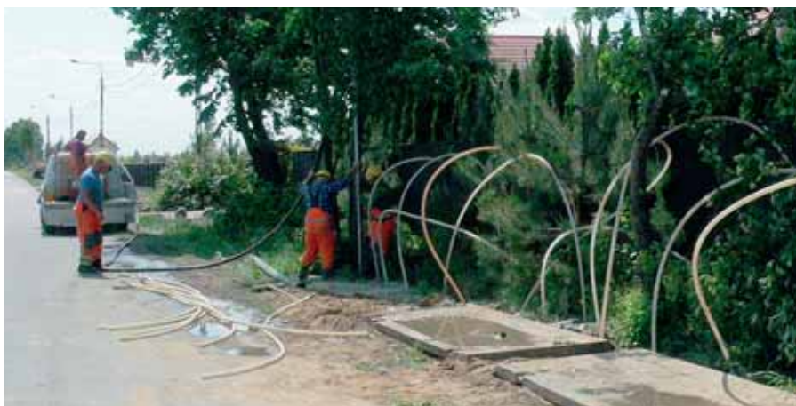
Odwadnianie gruntu przy pomocy igłofiltrów przy ulicy Spacerowej w Borzęcinie Dużym

Wykonawca tego zadania – firma Skanska – realizuje prace zgodnie z harmonogramem i planowane zakończenie na jesieni bieżącego roku nie jest póki