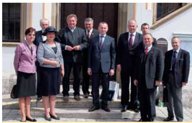
Wspólne zdjęcie uczestników spotkania przed ratuszem w Murnau