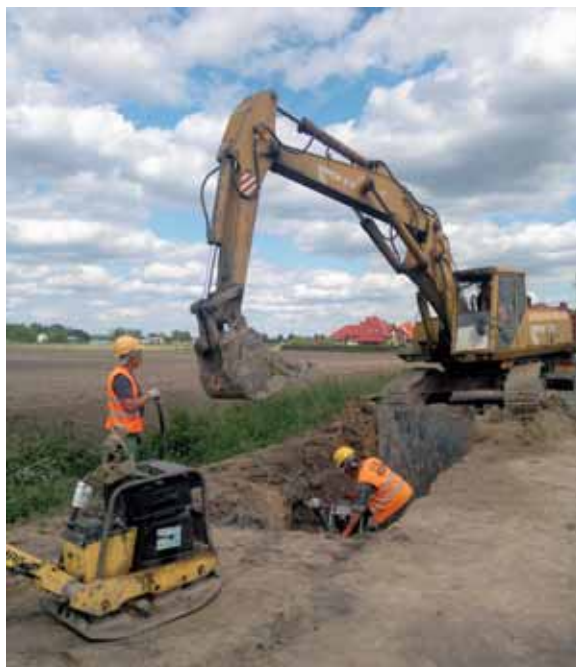
Prace przy ulicy Królowej Marysieńki w Wierzbinie. Zagęszczanie gruntu w wykopie

Poza okresem mrozów i występowania późniejszej zmarzliny wykonawca (firma Orpa) realizował to zadanie, lecz w naszej ocenie w tempie niewystarczającym. Obecnie zintensyfikował dzia-